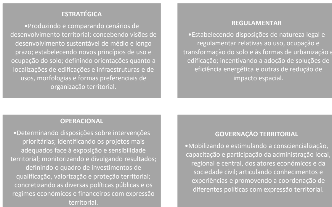
Figura 1: Principais formas de promover a adaptação local às alterações climáticas através do ordenamento do território e urbanismo