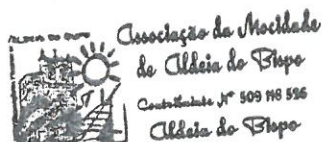
Sérgio Morais Gonçalves