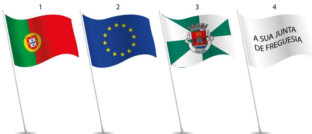
Ilustração 5 – Colocação da Bandeira Nacional num grupo de bandeiras em número par no exterior .