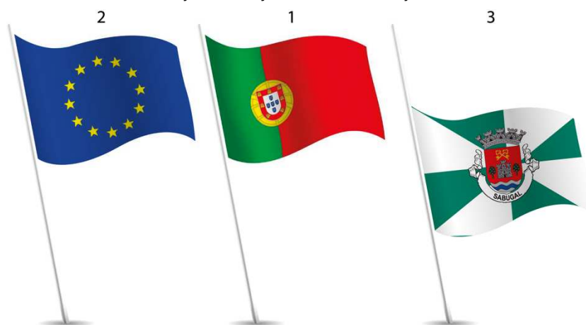
Ilustração 7 – Colocação das Bandeiras em situação de Luto Municipal.