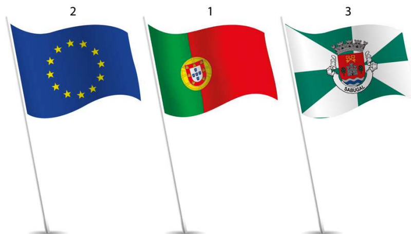
Ilustração 3 – Colocação da Bandeira Nacional juntamente com a Bandeira da União Europeia e uma outra (por exemplo a do Município do Sabugal).