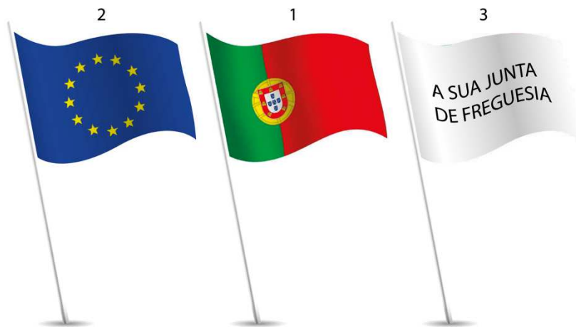
Ilustração 9 – Colocação da Bandeira Nacional juntamente com a Bandeira da União Europeia e a da sua Freguesia.

Situação 2: Se possuir a Bandeira Nacional, da União Europeia e a da sua Freguesia, a colocação é a seguinte: