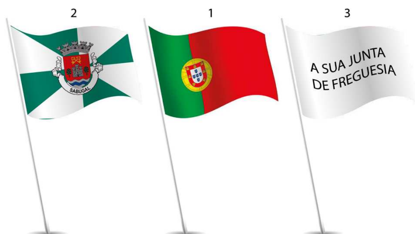
Ilustração 13 – Colocação da Bandeira Nacional juntamente com a Bandeira do Município do Sabugal e a da sua Freguesia.

Situação 5: Se a sua Junta de Freguesia apenas possuir 3 mastros, pode optar por substituir a Bandeira da União Europeia pela Bandeira do Município do Sabugal, de acordo com: