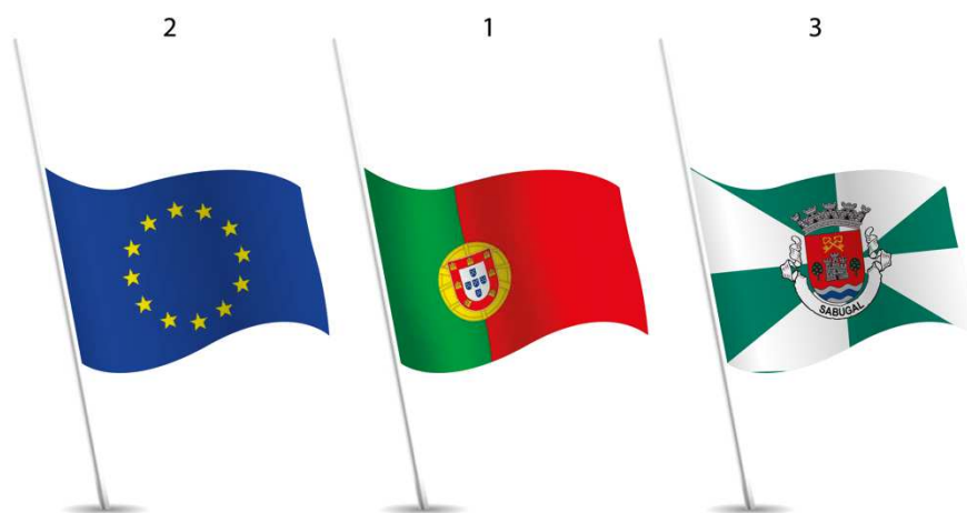
Ilustração 6 – Colocação das Bandeiras em situação de Luto Nacional.