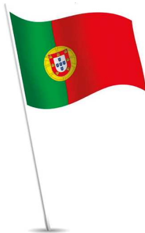
Ilustração 1 – Bandeira Portuguesa.

“A Bandeira Nacional é o símbolo visível da Pátria estando a sua utilização legislada pelo Decreto-Lei nº 150/87, de 30 de março, resumindo-se, de forma breve, no seguinte: