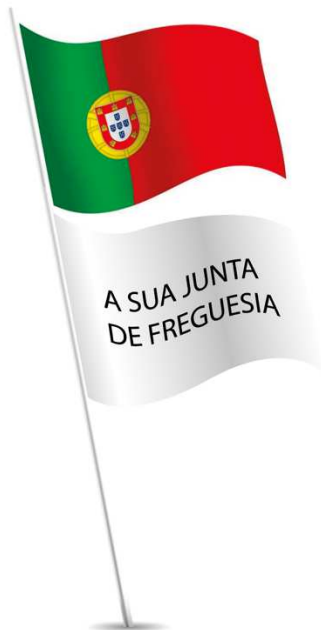
Ilustração 12 – Colocação da Bandeira Nacional juntamente com outra Bandeira (por exemplo a da sua Junta de Freguesia).

Situação 4: Se duas Bandeiras forem içadas no mesmo mastro, a Bandeira Nacional ficará no ponto mais alto: