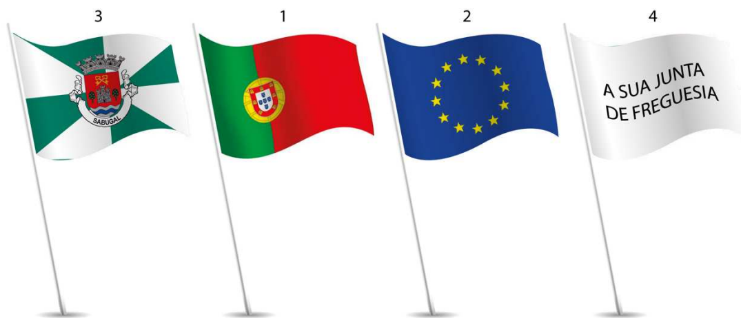
Ilustração 4 – Colocação da Bandeira Nacional num grupo de bandeiras em número par no interior .