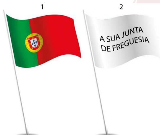
Ilustração 8 – Colocação da Bandeira Nacional juntamente com a da sua Freguesia.

Situação 1: Se apenas possuir a Bandeira Nacional e a da sua Freguesia, a colocação é a seguinte: